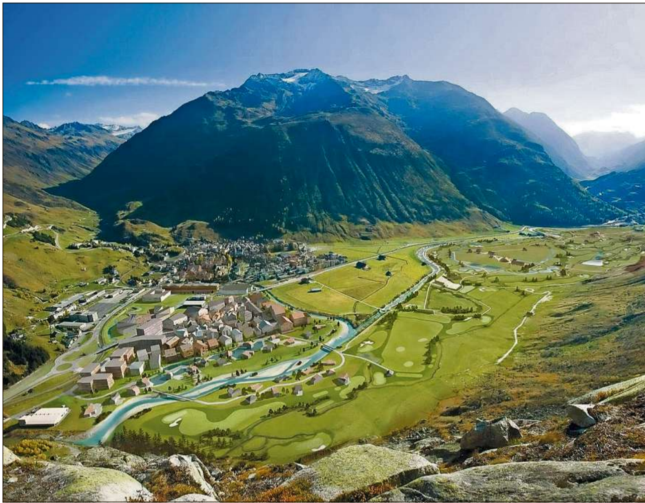
Il vitg dad Andermatt sa chatta actualmain en ina fasa da transformaziun.

Vallada che s'estenda dal Cuolm d'Ursera al Pass dal Furca. Chats da munaidas datan perdita dal transit tras la Val d'Ursera dapi il temp roman. A partir da ca. l'onn 600 furmava la val il cunfin tranter las quatter diocesis da Milaun, Sion, Constanza e Cuira. Dapi il 8avel tschientaner appartegniva ella a la Cadi, quai vul dir al territori feudal da la claustra da Mustér. Quest territori era cuvert da quel temp da guauds spess ed era strusch populà. Tran-